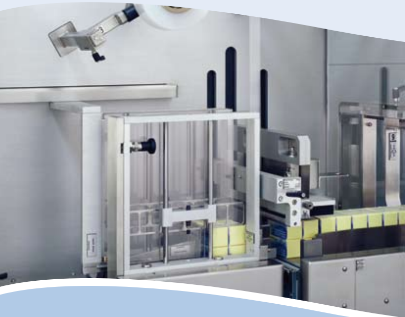
Faltschachtelstapelung und Schweißstation